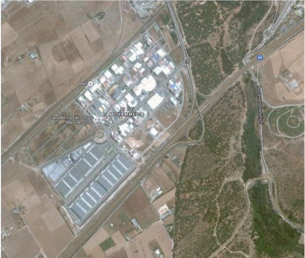
Zone industrielle de Mohammédia