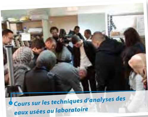
● Cours sur les techniques d'analyses des eaux usées au laboratoire