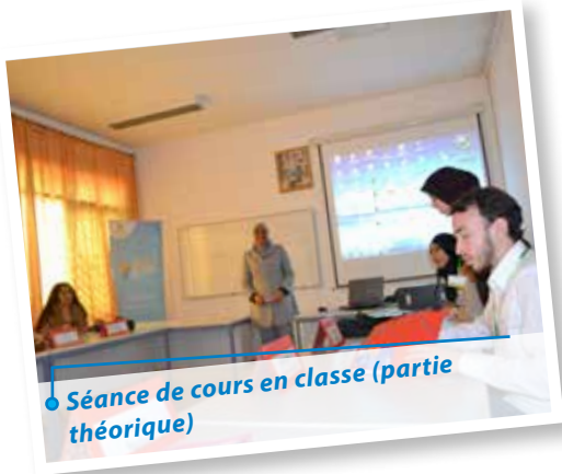
● Séance de cours en classe (partie théorique)