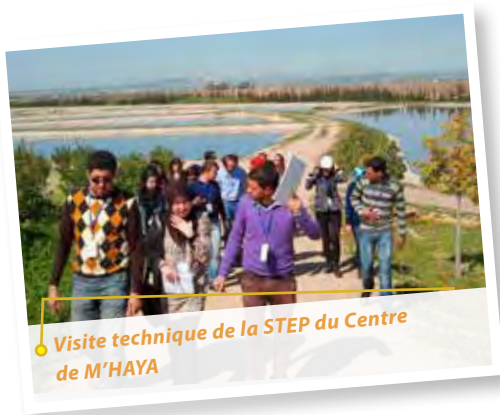
● Visite technique de la STEP du Centre de M'HAYA