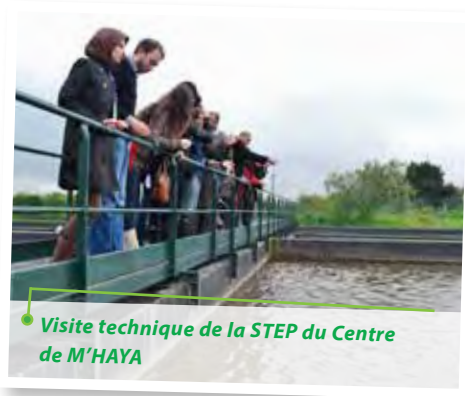
● Visite technique de la STEP du Centre de M'HAYA