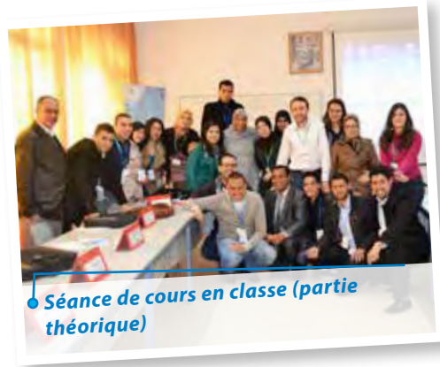
● Séance de cours en classe (partie théorique)