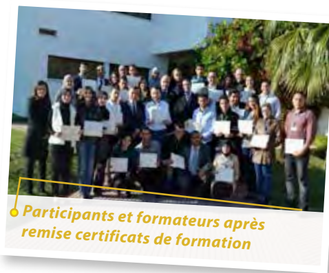
● Participants et formateurs après remise certificats de formation